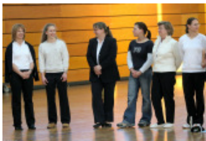
Das KaRi-Team 2006

Anmerkung: es ist keine 12x12-Bodenfläche vorhanden, sondern eine Tumblingbahn in Länge der Diagonale.